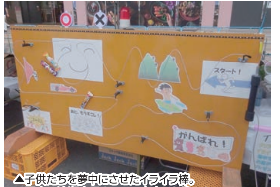
△子供たちを夢中にさせたイラストボード。写真は清瀬市民まつりに出店した際のもの

3階のイラストボードのコーナーで子供たちの様子を見ていただき、清瀬市民まつりに参加した時と同様大人気でした。みんなの粘りこんで、3回くらい粘って景品をゲットした子もいました。本気になりすぎてミスした際に泣いてしまった女の子もいました。