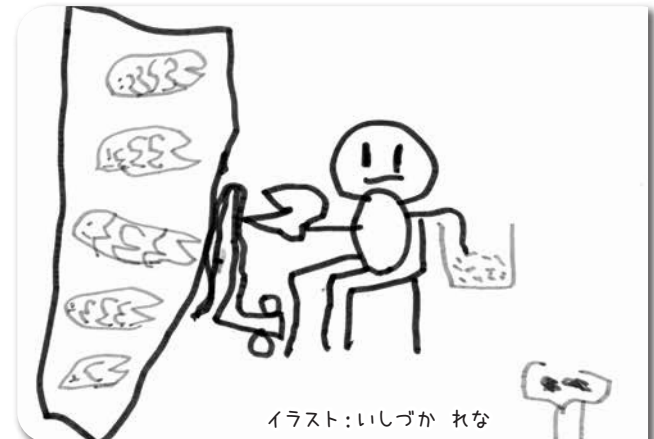
イラスト: いしづか れな