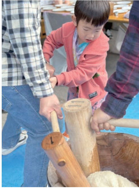
恒例の餅つきも開催。こねる作業をお手伝い中

10月29日(日)に支部会館にて東京土建の日感謝祭が開催されました。10月1日に行われた東京土建の日の協力者の方々に感謝の意を込めてたくさんの方々がそれぞれの家族、ステージ出演者が参加し交流しました。焼き鳥などの食べ物ブースが盛りだくさんで、お餅つきでは老若男女問わず皆参加し交流しました。 恒例の餅つきも開催。こねる作業をお手伝い中 3階のイラストボードのコーナーで子供たちの様子を見ていただき、清瀬市民まつりに参加した時と同様大人気でした。みんなの粘りこんで、3回くらい粘って景品をゲットした子もいました。本気になりすぎてミスした際に泣いてしまった女の子もいました。率直に、ここまで子供がここまで本気になるゲームを作る職人集団はすごいな、と思いました。 開始から終わりまでいまま