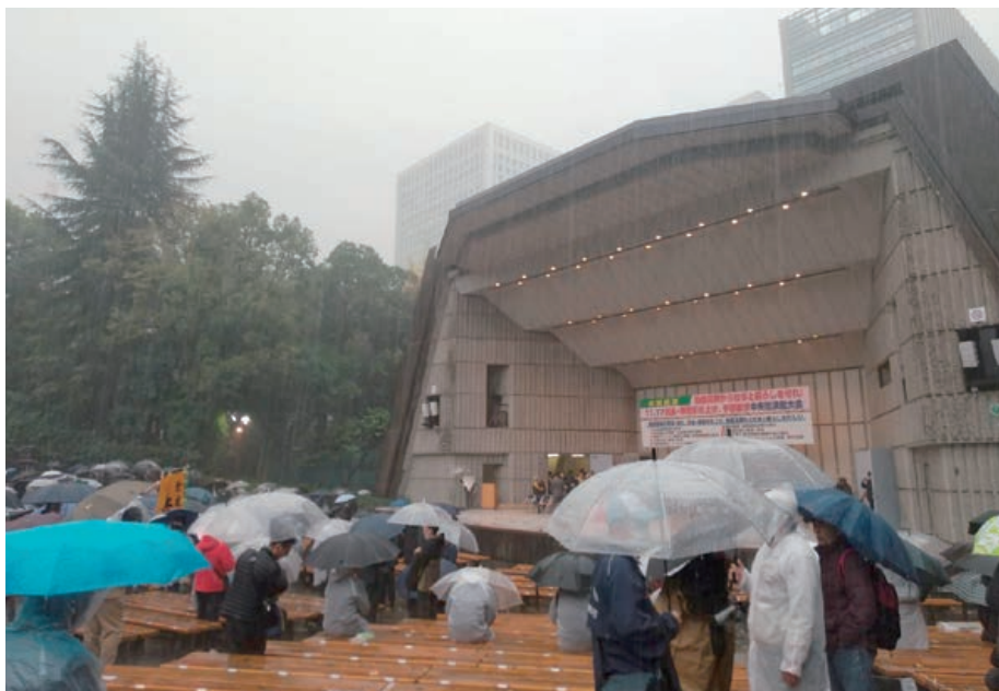
大雨の日比谷野音