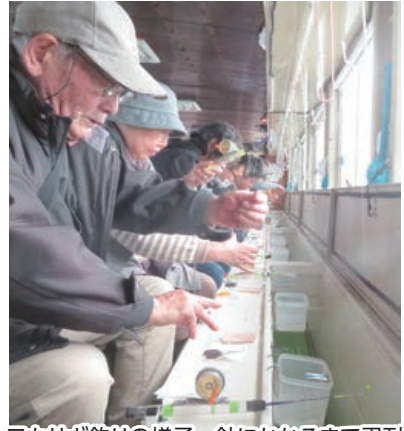
ワカサギ釣りの様子。針にかかるまで忍耐

組合員家族含めて37名は、松竹分会合同のバスレクを、一路山中湖へ向かい、ワカサギ釣りを楽しみました。朝食では釣ったワカサギをから揚げにして食べる人もいました。午後には忍野八海を散策し、お土産も忘れずに買って帰路につきます。途中で、20キロ渋滞に見えます。 参加したご家族から、感想とイラストをいただきましたので、そのまま掲載します。