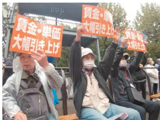
▶都心のビル街をデモ行進 ▲賃金・単価の引き上げを求めて！